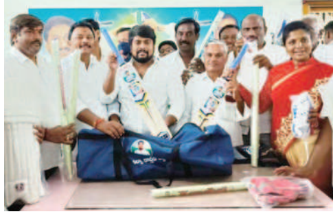
తెలిపారు. ముఖ్యమంత్రి యువకుల్లో క్రీడాస్ఫూర్తిని నింపేందుకు గ్రామీణ స్థాయి నుండి రాష్ట్రస్థాయి, జాతీయ